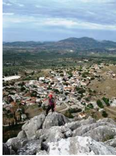
Στο τέλος της διαδρομής