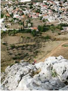
Στην 5η σχοινιά