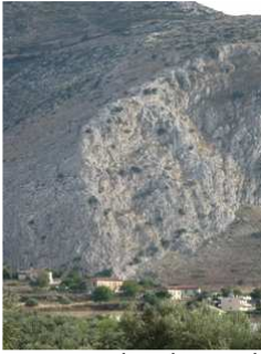
Η διαδρομή από μακριά