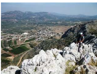
Στο τέλος της διαδρομής