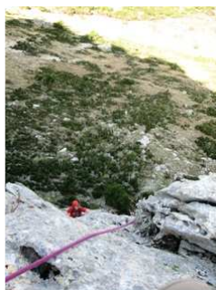
Το τέλος της 1ης σχοινιάς