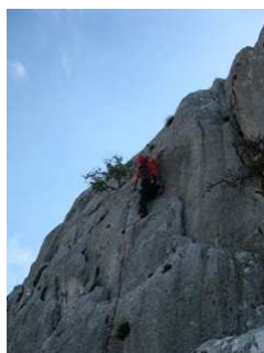
Στη 5η σχοινιά