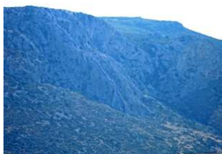
Η διαδρομή από μακριά