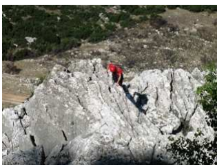
Στη 4η σχοινιά