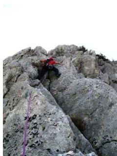
Στη 2η σχοινιά